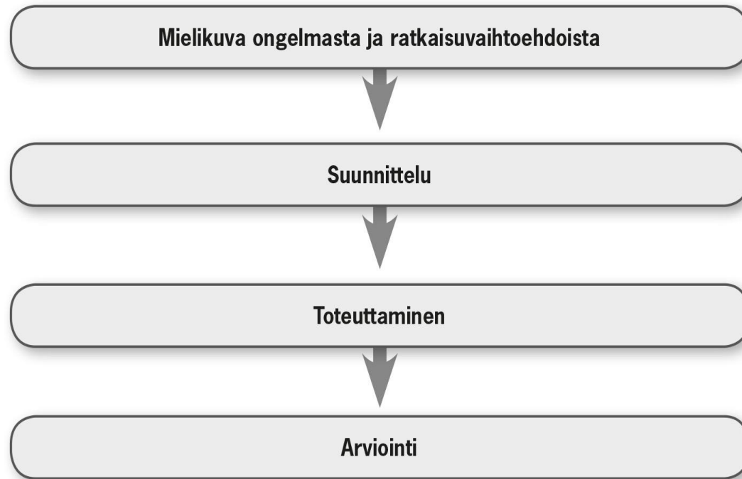
Kuvio 1: Ongelmanratkaisun vaiheet (mukailtu Zelazo ym. 1997)